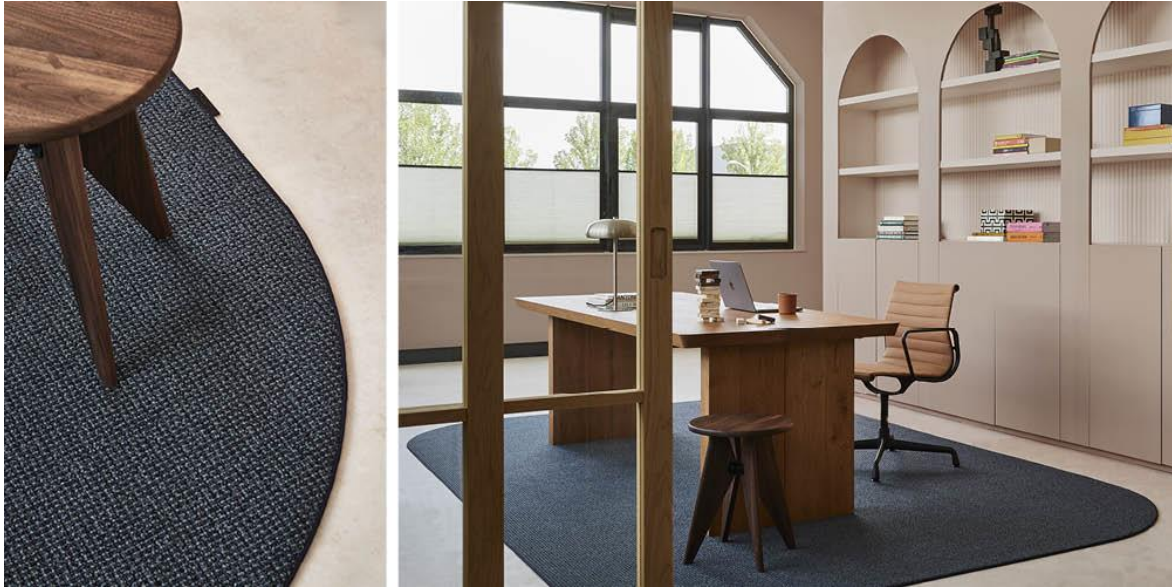
Foto: Tapijtcollectie Parade Studio van dessotarkett.nl